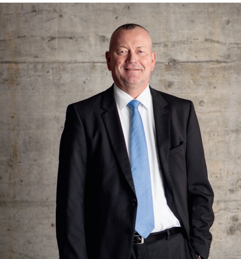
Urs Roth, CEO del Gruppo Visana

Per maggiori informazioni relative all'anno d'esercizio 2015 consultate il nostro Rapporto di gestione alla pagina reports.visana.ch/it . Da qui potete ordinare il Rapporto di gestione anche in forma stampata che verrà consegnato a partire dal 19 aprile 2016.