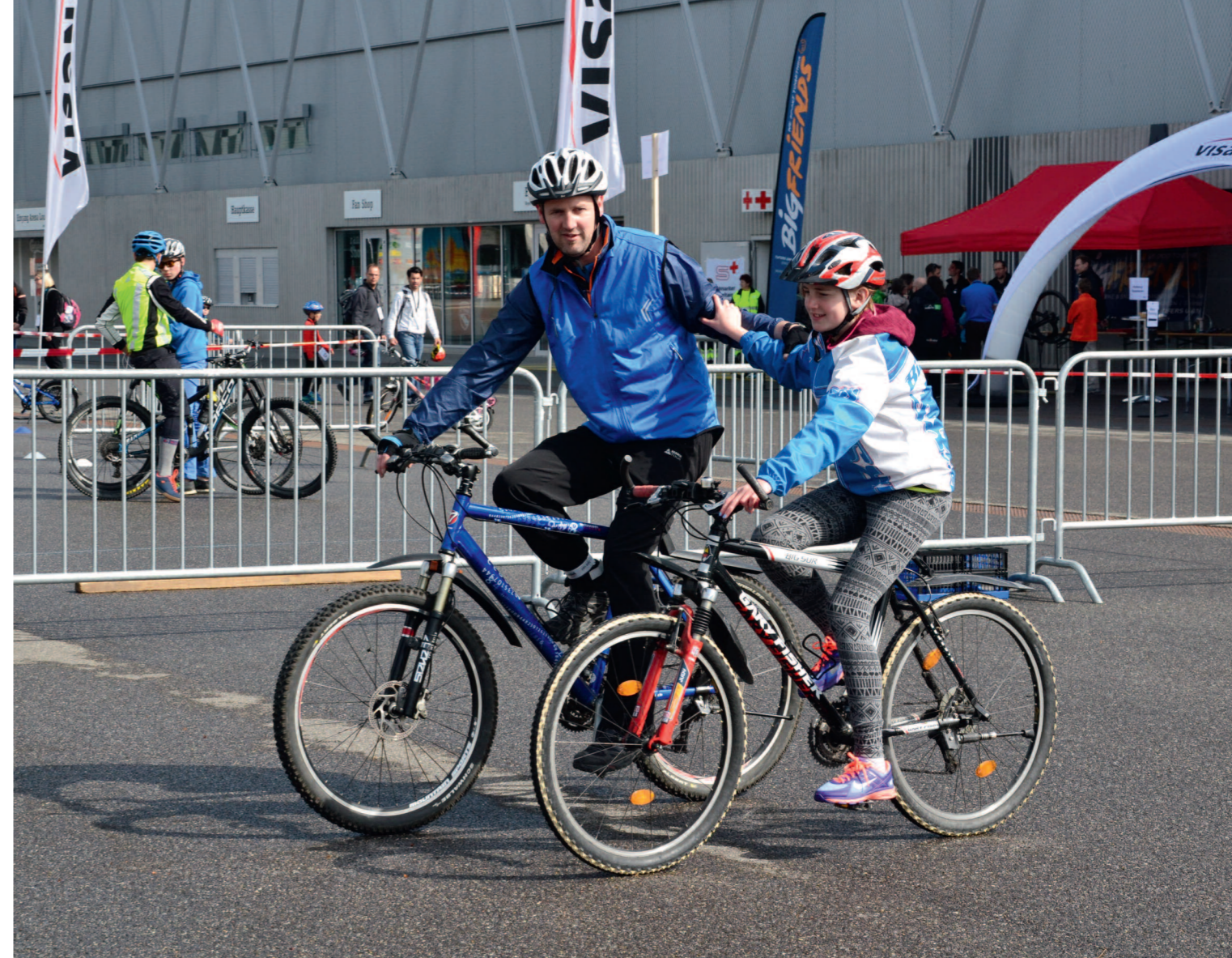
Più competenze di guida per tutta la famiglia.